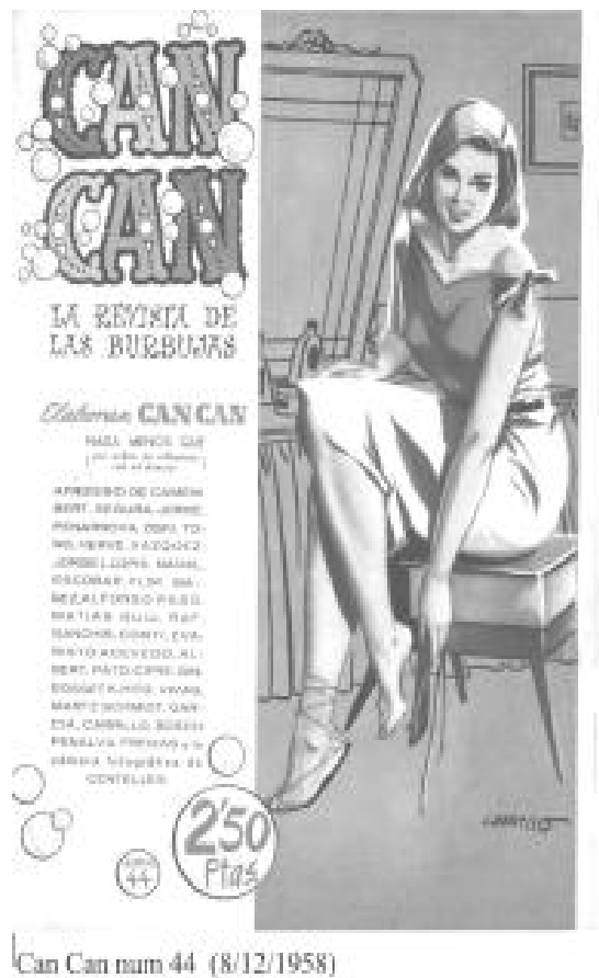
Can Can num 44 (8/12/1958)

Si bien el dibujo de chicas, le ha dado una fama mas que merecida, Carrillo no disfrutaba dibujando estas series, pues la mayoría eran con guiones ajenos y lo que le gustaba a él era poder dibujar series de aventuras con guiones propios, lo cual volvió a hacer a finales de los años 60, tras unos meses en los que no publico nada dedicado íntegramente (tras “comprar tiempo” según sus propias palabras) a crear la serie de Gora Gopal.