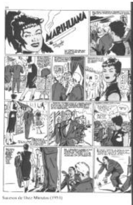
Sucesos de Diez Minutos (1953)

Espoleado por la discusión y dispuesto a demostrar a sus padres que estaban equivocados se presentó en las oficinas de Editorial Espejo, y consiguió mostrar al director de Diez Minutos dos historietas de dos páginas una bajo el título de Opio, y otra sobre el Mau Mau basadas en artículos aparecidos en la prensa sobre los traficantes de drogas orientales y sobre la revuelta del Mau Mau en Kenia, que firmó como Carrillo (apellido de su abuela paterna) y que le aceptó inmediatamente solicitándole que le hiciera una cada semana, basadas en temas reales, para publicarla en la revista Sucesos semanario dedicado como su propio título indica a relatar sucesos de actualidad, pagándole 100,- Ptas. por página publicada.