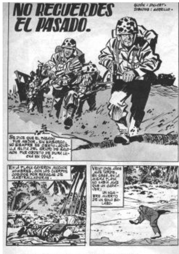
Brigada Secreta nº 134 (1965)

A partir de 1968, va retomando de nuevo su faceta inicial aventurera creando el “doc Foran el aventurero” para la revista Bravo (ed. Bruguera) y en las que cuenta las peripecias de un cazador blanco en pleno corazón de África.