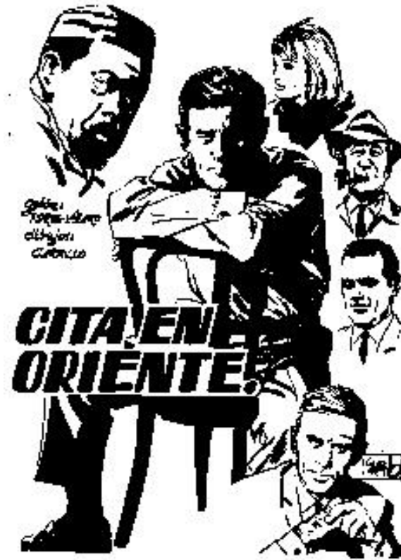
Espionaje nº 8 (1965)

- algunos episodios de Espionaje , serie de novelas graficas de editorial Toray