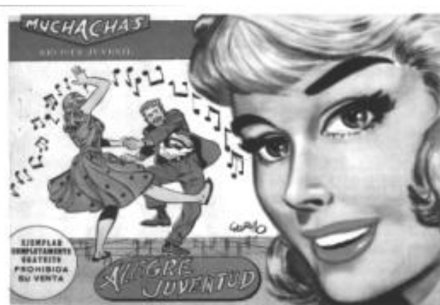
Editorial Maga (Valencia, 1960)