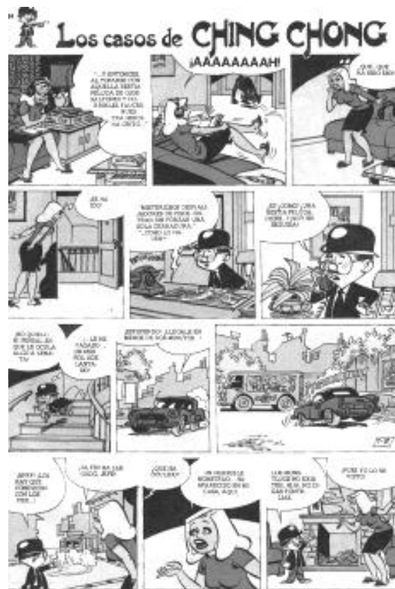
Bruguelandia n° 9 (15/03/1982)