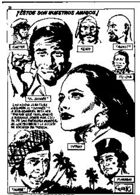
El Javanes nº 1 (1970)

En 1972, crea Gopal para Súper Pulgarcito , y que termina de desarrollar en Gora Gopal en Zeppelin (Buru Lan de ediciones) y sobre todo en 1974 en que la revista Chito (Grafimart) edita 18 episodios de la serie, en la que se narran las aventuras de una especie de Mowgli tarzanesco en la exótica selva india, con lo que nos acercamos de nuevo a los temas preferidos por Carrillo: aventura y exotismo.